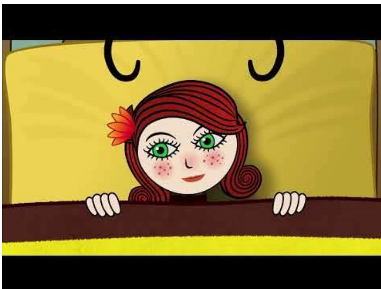
A méhek a lényeg

A méhek a lényeg - játékos előadás a méhek életéről